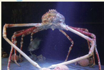
こんな体勢なのに、キミ腰痛ないの!?

ヨロヨロ歩きで水族館を歩いて疑問に思ったのですが、魚には腰があるのかないのか。魚類学に詳しい(館長よりも詳しい)副館長に聞くとクジラは腰の名残があるけど魚に腰はないんじゃないか?という。自分で調べてみると、人間には「魚腰」という眼精疲労に効く眉毛の真ん中あたりに位置するツボがあるというところが分かりましたが、肝心の魚の腰についてはよく分からない。