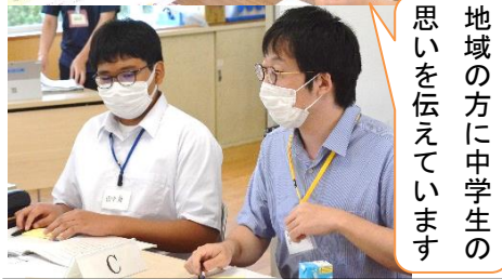
地域の方に中学生の 思いを伝えています

7月24日(日)に、形原地区「まちづくりと公共施設の将来を考えるワークショップ」の第1回(全5回)が本校で開催されました。これは、人口減少・高齢化が進む社会情勢を見据え、各地区にある公共施設の将来の配置や使い方について、住民のみなさまと考えるため、蒲郡市が企画したものです。