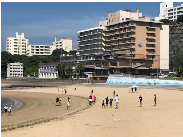
▲活動の前にビーチクリーン(^_^)