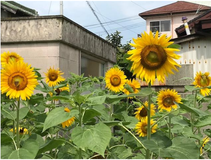
▲夏らしさ満開！かわいいひまわりたくさん咲きました。

■やっぱり夏はひまわりですね。西浦小の3年生の子どもたちが当番を作って、水やりをしてくれました。「はるかひまわり」無事に咲きました。通りがかる地域の方々が、足を休めて見てくださいます。やがて、ひまわりは種をとって、また来年も咲かせます。この「ひまわり」のあとは、「コスモス」を植えたいと思います。また、みなさんのご協力よろしくお願ひします。