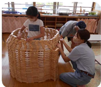
☆☆お父さん、お母さんとカプラでかまくらを作りました。