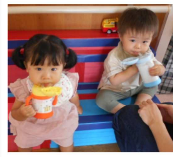
♡「ちょっとひとやすみ」