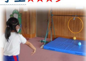
「ボールくぐらせゲーム」高さや形の違う輪に投げて遊びました。