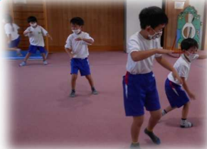
「キャップおに」落とさないようにそろりそろり。