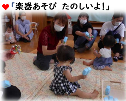
♡「楽器あそび たのしいよ!」