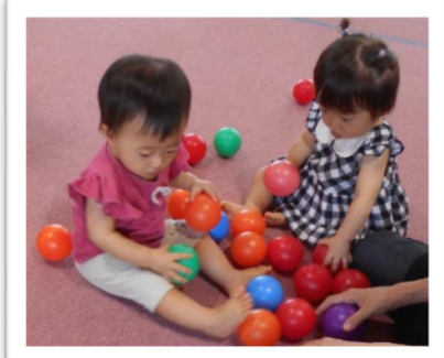
♡「ボールいっぱいねー」