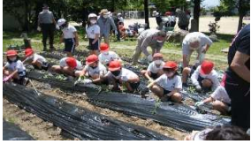
四年生の生徒さんとサツマイモの苗植え

5月25日(水)に中央小学校5年生の生徒さんと玉ねぎの収穫を行いました。6月8日(水)には中央小学校4年生の生徒さんとサツマイモの苗植えとジャガイモの収穫を行いました。多くの会員の皆さんの指導の下、参加者全員で収穫の喜びを味わうことができました。ご協力ありがとうございました。