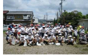
五年生の生徒さんと玉ねぎの収穫