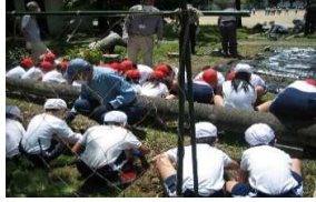
四年生の生徒さんとジャガイモの収穫