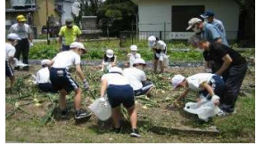
五年生の生徒さんと玉ねぎの収穫