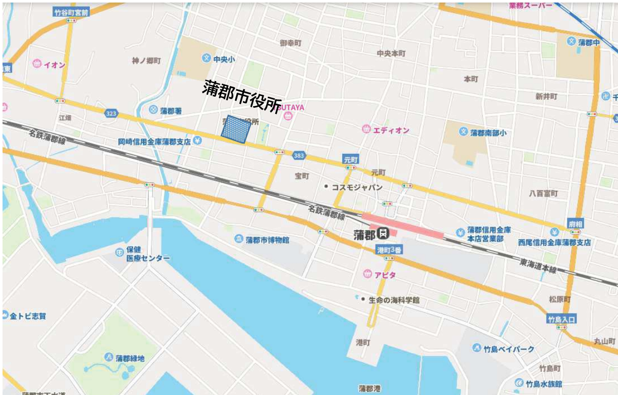
会場周辺図（蒲郡市立大塚小学校 避難所開設、医療救護所訓練）