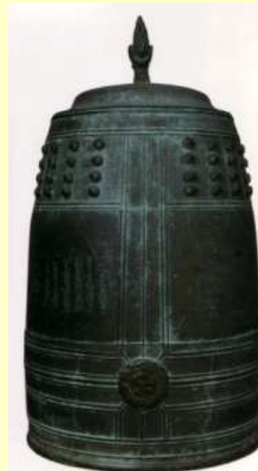
「しょうぜんじ」に ありました

12月31日・大みそかの夜から、年があらたまって 1月1日・元旦になるころにかけて、お寺のかねを10 8回ついて鳴らすというならわしがあります。人間には 心や体をなやませ苦しめる「煩惱」というものが10 8個あるといわれます。一年の最後に、同じ数だけかね を鳴らすことで、なやみや苦しみを取りのぞき、すっきりと新年をむかえるのです。