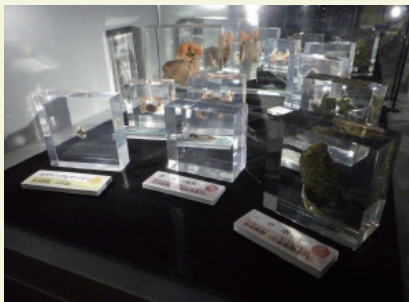
竹島で見られる生きものたちの樹脂包埋標本です。

戻ってマメコブシガニの特徴をスケッチするうちに、恐る恐るですが力二に触れるようになり、そのことに自分でもびっくりにしているようでした。自分の働きかけで生きものに興味を持ってくれたことが純粹に嬉しく、「意外と大丈夫かも!」という女の子の言葉と笑顔を思い出すと、寒さを忘れて作業を進めることができます。 冬の間は標本を眺めながら、子どもたちとの思い出を温かいカイロの代わりにして、春はあけぼのの季節を待ちたいと思います。