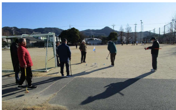
令和元年度のグラウンドゴルフ大会の様子