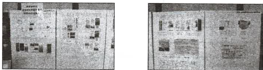
形原中学校1年生の研究発表