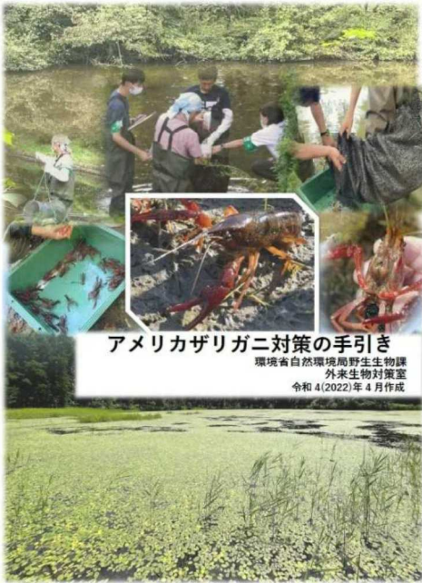
アメリカザリガニ対策の手引き https://www.env.go.jp/nature/amezari_kakuchi.html