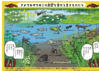
アメリカザリガニによる影響のSNS発信