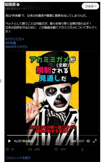
アカミミガメの規制内容のSNS発信