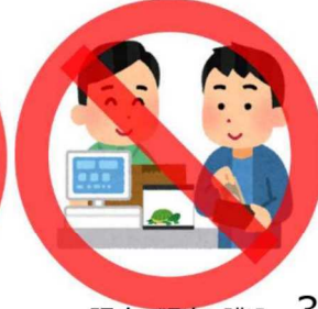
販売・頒布・購入 3