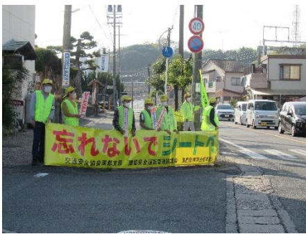
「交通安全を呼びかけるみなさん」

4月12日に春の交通安全運動の一環として一斉立ち番が大塚駅前交差点で午後4時から、蒲郡警察署交通課長以下30余名の参加で行われました。交通安全期間中に蒲郡市で今年2件目の交通死亡事故も発生したことを受け、より一層気をつけるようにと訓示があり、全員で交差点付近で交通安全を願ってドライバーや通行人に呼びかけをしました。