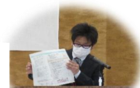
《包括センター稲吉さんの講話》