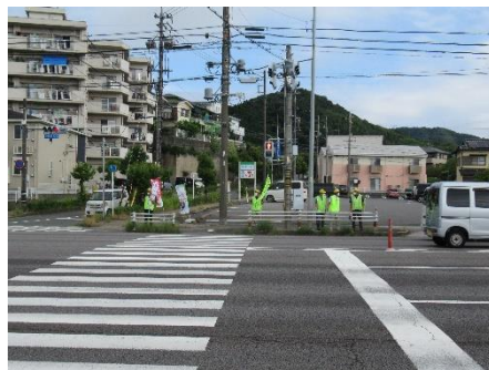
《交通死亡事故の交差点》

今年、蒲郡市での3件目の死亡事故でした。皆さん、交通事故に合わないよう十分に気を付けましょう。