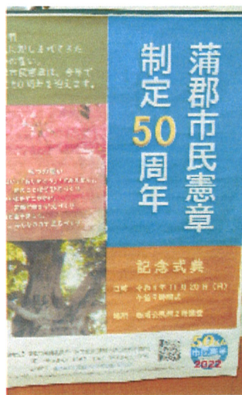
蒲郡市民憲章制定50周年

J A蒲郡市がR4. 3月に50周年を迎えるにあたり、地域貢献として公民館に物品の寄付をしたいというお話をいただきました。 ちょうどR4年度は市民憲章50周年事業とも重なるため、市民憲章にちなんだもの(読み上げ用パネル)と、公民館が今後地域の子どもたちの作品を展示していくためのパネルを提案し、賛同をいただき寄付をいただけることになりました。