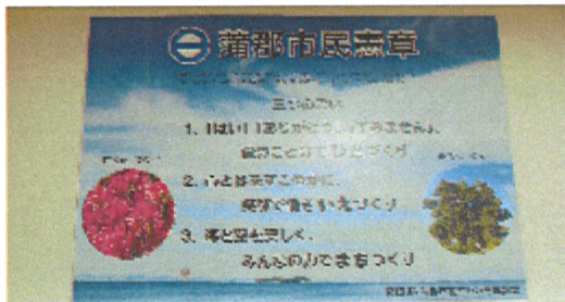
市民憲章の読み上げパネル