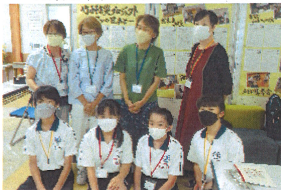
2日目のボランティアの皆さん