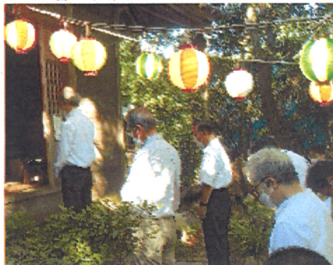
府相区民の無病息災を願って