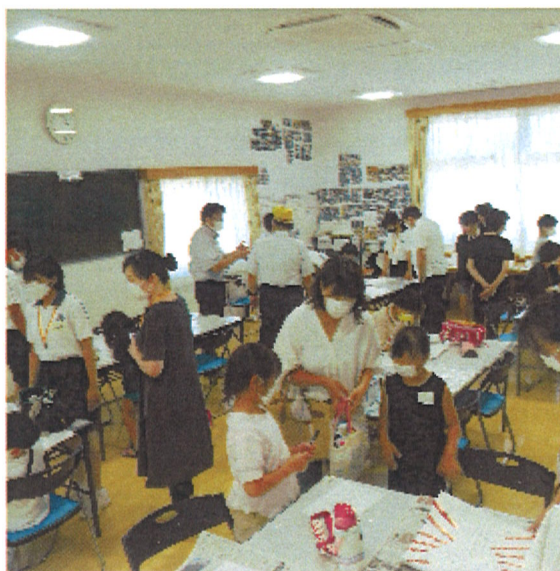
たくさんの方の協力がありました