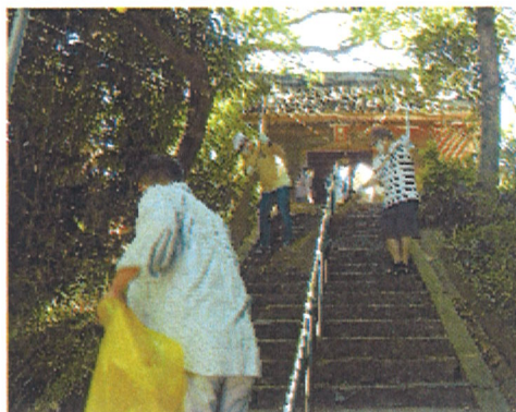
暑い中ありがとうございました

令和4年7月23日(土)に旧府相公民館横の府相区の氏神様、御鋸神社にて規模は縮小しましたが、御鋸神社の清掃後神事をしてそのあとに提灯を点灯いたしました。