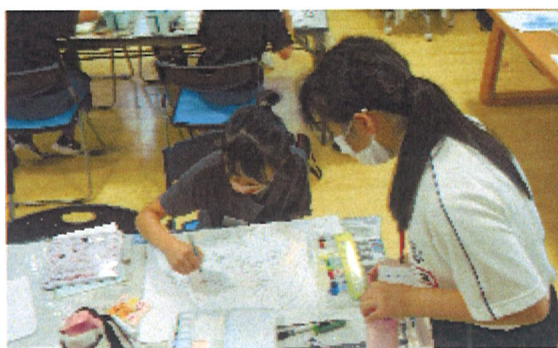
力作ができました