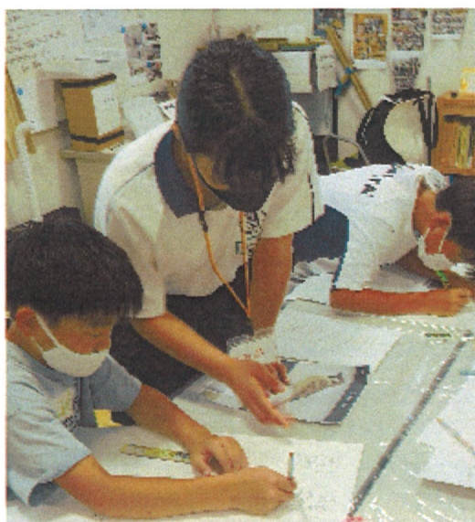
お兄さんお姉さんが優しく教えてくれました