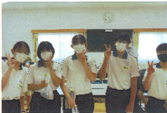
1日目の中学生ボランティアの皆さん

これを機に府相公民館を積極的に利用していただき、皆さんにとって楽しい施設になれたらと思います。これからもよろしくお願ひします。