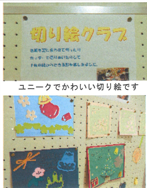
ユニークでかわいい切り絵です