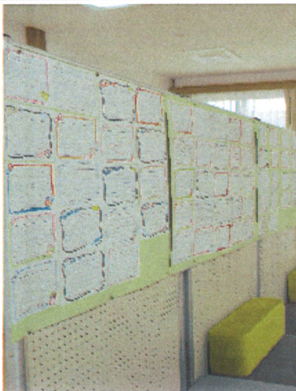
公民館に展示していました