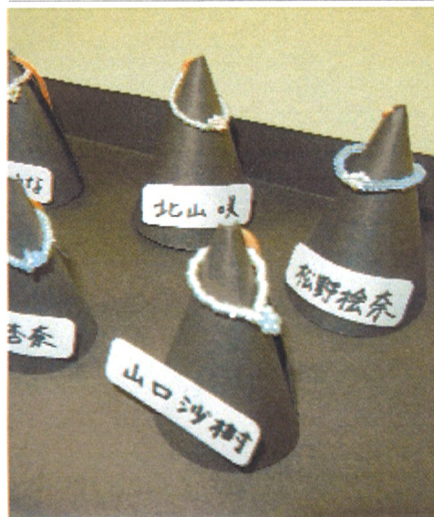
ハンドクラフトは細かい作業です