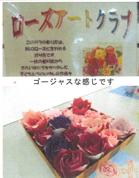
ゴージャスな感じです