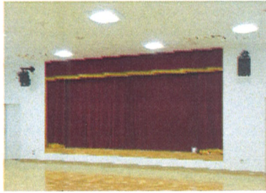
ホール1, 2 (大きいホール)

府相公民館が竹島から竹島小学校の敷地内に引越して2年が経ちました。このタイミングで度重なる利用制限などで利用者の方々には多大な不自由をおかけしました。今年度こそ一年通して楽しく利用できる施設へと精進いたします。 府相公民館職員一同