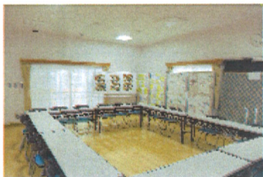
交流プラザ (多目的広場)