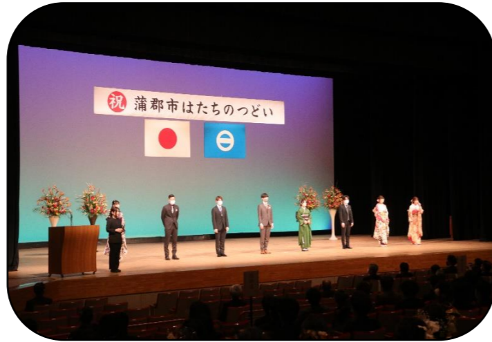
今年の式典の様子(蒲郡市民会館にて)

今号では、中学校3年生当時の恩師からのお祝いの言葉と、今回実行委員を務められた両名に、新成人になった抱負等を投稿していただきましたので、ご紹介いたします。