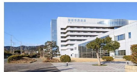
右：新棟配置計画「海風 No.14」より