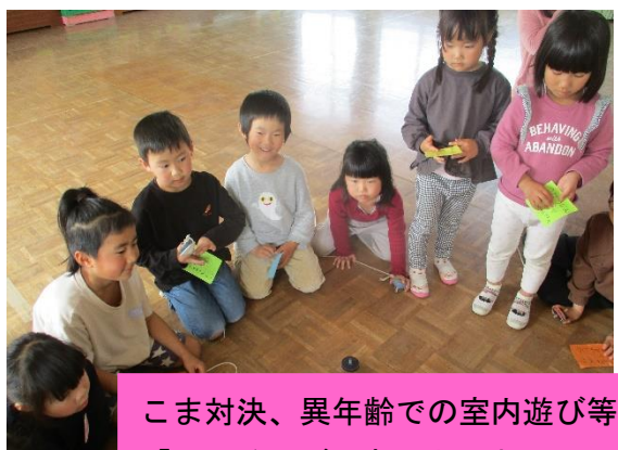
こま対決、異年齢での室内遊び等をして、他クラスの友達への興味が広がりました。「〇〇くんが、あやとりおしえてくれた！」「〇〇ちゃんがぬりえくれた！」等、年長児の優しさも感じることができました。