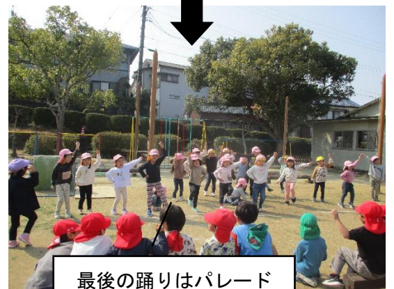
最後の踊りはパレードのように賑やかでした