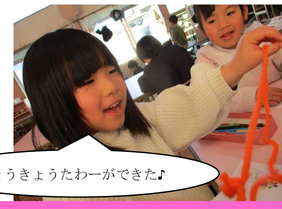
とうきょうたわーができた♪