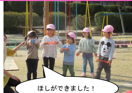
ほしができました！