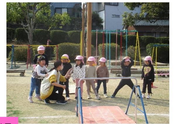
「あかぐみさん、みどりぐみさん おもしろい！いっぱいよろこぶかい」(子どもたちが命名)をしました！年長児に見てもらいたい技を1つ決めて披露しました。年長児に見てもらい、認めてもらう喜びや自分達が進級することへの期待を感じることができたのではないかと思います。