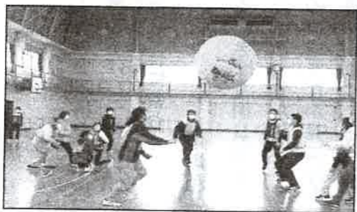
ボールを落とさないように

相手の弱点を如何に突くかがポイント。コート狭ましと動き周り、時折珍プレーも飛び出すなど、和やかな交歓会となりました。