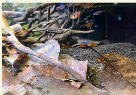
魚だけでなく落ち葉もコンディションの良いものを展示中です。

とよおか湖周辺は公園もあるので平日でも散歩している方が多く、落ち葉を拾っていると3人に1人は警戒の視線で通り過ぎ、3人に2人は「何をしているのですか」と話しかけられます。「落ち葉を拾っています」と答えると「ええ。ですよね。」正直に返答したつもりでも、質問者側はそんなこと見ればわかっている、だから拾って何をしておるのだ、という感情を顔面から放散します。そのため、先に書いた落ち葉の効果効能を説明すると「そりゃ、苦勞様ね」といって今度は、変な人に出会って