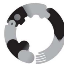
CCG ロゴ_A [モノクロ] 濃い背景