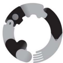
CCG ロゴ_A [モノクロ] 淡色背景