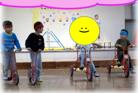
大型三輪車・スクーター