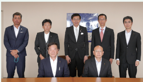
私たちが編集委員です。