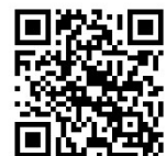
図書館のホームページ