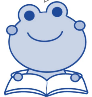
マスコットキャラクター めくるくん

としょかん しりょう 図書館 としょかん の資料 しりょう には ほん かみしばい 本 ほん ・紙芝居 かみしばい ・CD・DVD などがあるよ