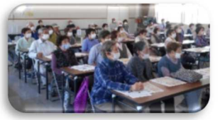
第2回：高齢者教室の様子

◇6月の行事予定◇ 第3回高齢者教室 6月28日(水) 午後1時30分から 大型紙芝居「を 開催します。 陽気もよい時期 なのでみなさん ご参加をお待ち しております。