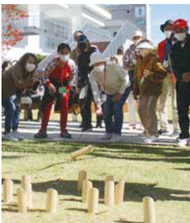
▲ゲームを通せば、誰でもあつという間に仲良くなれます。