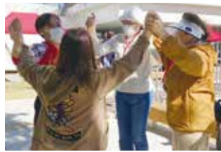
▲一回戦はチームワークで勝利!!

豊橋技術科学大学カーボンニュートラル研究会主催で行われた、モルックにSDGsを組み合わせたゲームに、蒲郡国際交流協会メンバー4名と蒲郡市在住のフィリピン人2名が参加しました。他市の国際交流協会のチームと2試合ゲームを行いました。秋空の下、モルックを通じた交流を楽しみました。