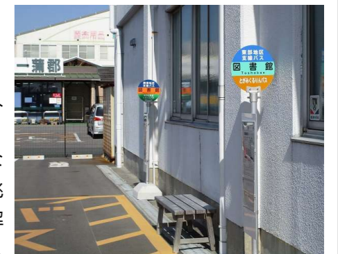
図書館の2つのバス停

とがみくるりんバスは、図書館で西部地区のバスと、三河三谷駅で三谷地区のバスと接続しています。接続時刻はとがみくるりんバス時刻表(こちらも公民館のロビーにあります)に記載していますが、左の乗り換え案内サイトでも調べることができます。来年1月には西浦地区のバスが運行開始予定です。他地区のバスもご利用下さい。