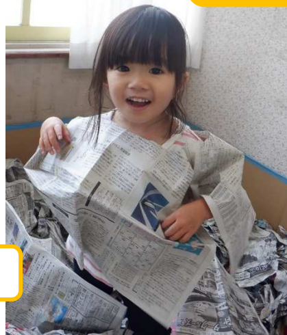
お洋服になっちゃった!