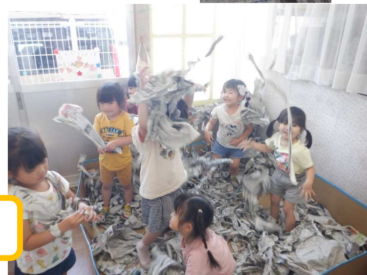
ぐちゃぐちゃってたのしい!!!