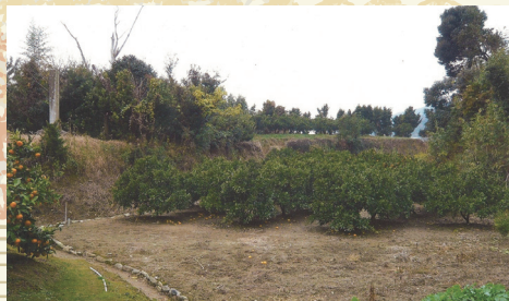
市指定史跡「上ノ郷城跡」 (大河ドラマ「どうする家康」で一躍有名になった 上ノ郷城も、市の大切な文化財です。)