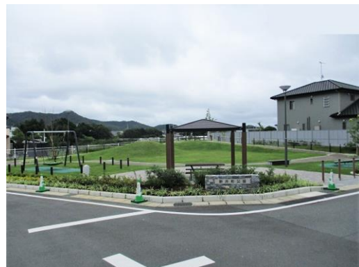
新井形公園整備状況写真