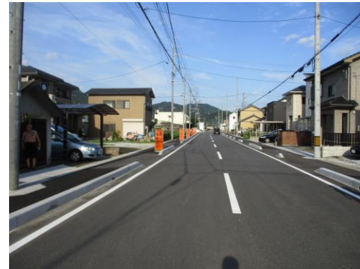
道路整備状況写真