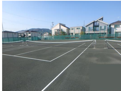
蒲高テニスコート整備状況写真