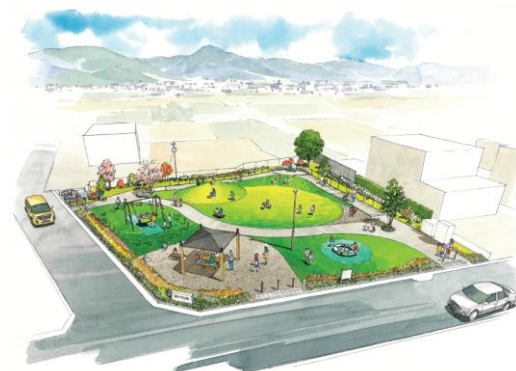
新井形公園鳥かん図 (令和3年度施工予定)