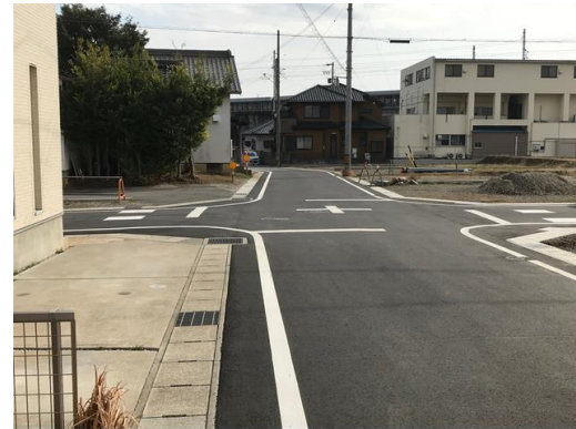
道路整備状況写真