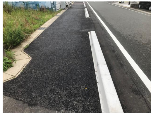
歩道整備状況写真