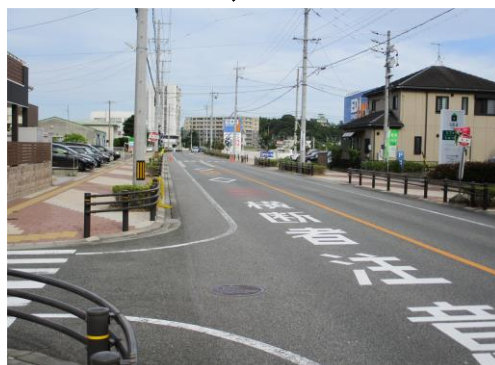
都市計画道路 松原線