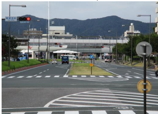
都市計画道路 蒲郡港線