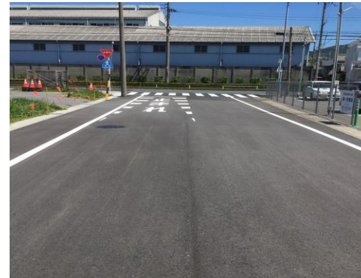
区画道路8-4号 舗装整備状況写真 (令和元年度施工)