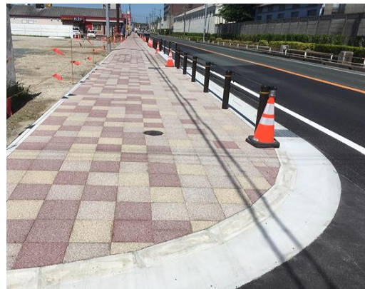
都市計画道路 海岸線 道路整備状況写真 (令和元年度施工)