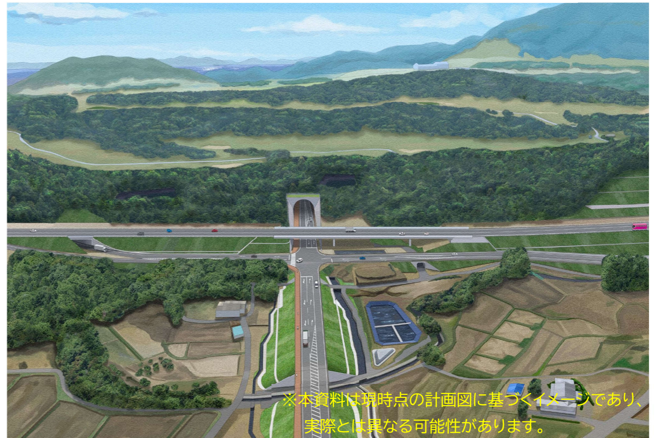
完成予想図3(金野 IC(仮称)交差点から南を望む)