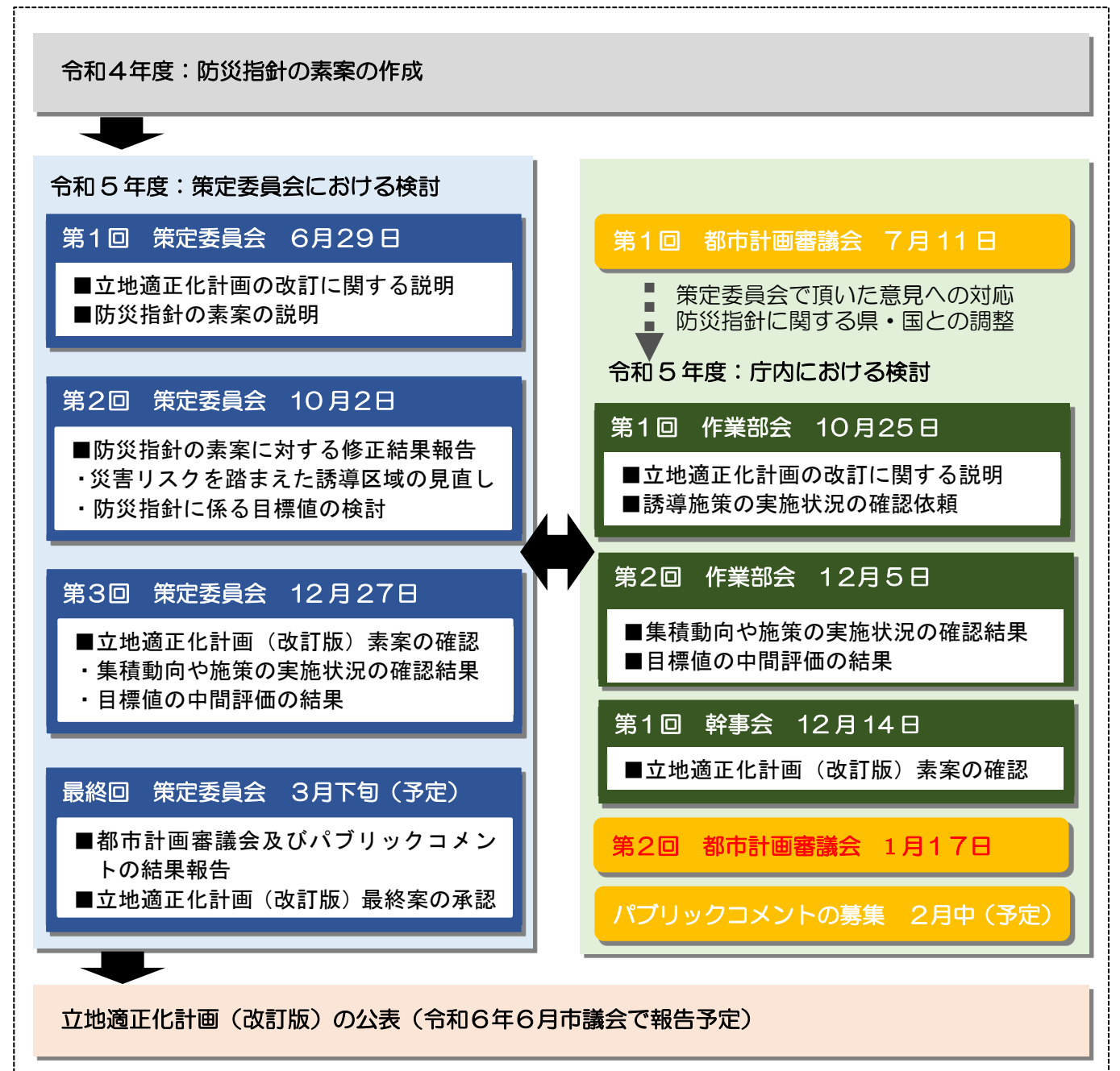
■蒲都市立地適正化計画の改訂スケジュール（案）