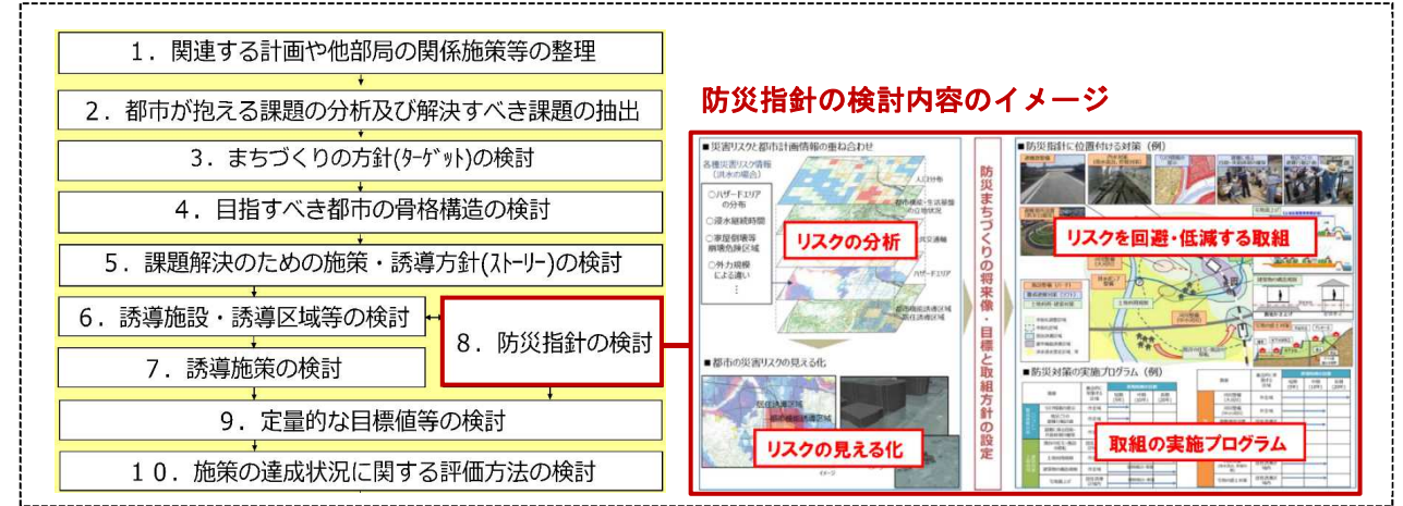
■立地適正化計画における防災指針の位置づけ

都市再生特別措置法の改正（令和2年6月）により、頻発・激甚化する自然災害に対応した、安全なまちづくりの推進に向けて、立地適正化計画の項目として新たに「防災指針」を位置づけます。