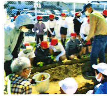
【ジャガイモ植付】(竹島小)