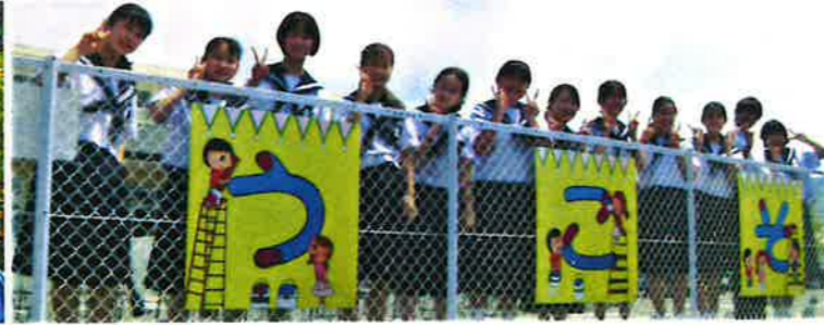
【府相公民館看板制作】(蒲郡中)