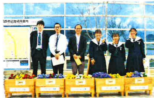
【ともに咲かそう笑顔の花】(蒲郡中)