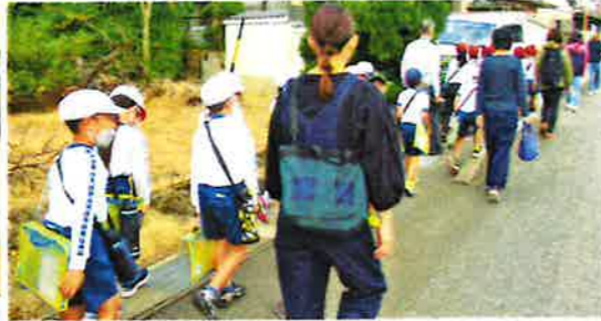
【町探検引率】(蒲東小)