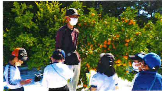
【みかん農家取材】(蒲東小)