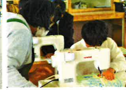
【ミシン操作支援】(蒲南小)