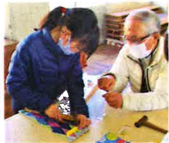
【釘打ち支援】(竹島小)