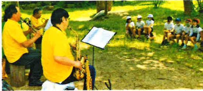
【蒲南の森ミニコンサート】(蒲南小)