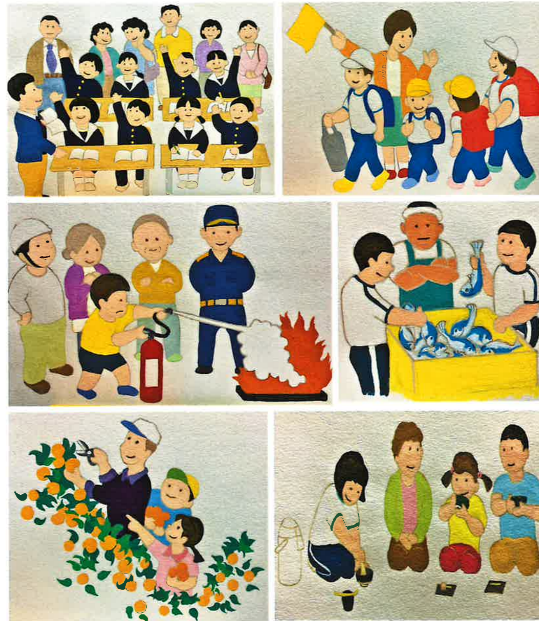
イラスト出典 稲吉政司先生(蒲郡中)