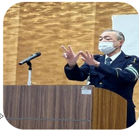
彦坂交通課長による交通講話

また、東部地域包括支援センターの専門員からは「人生100年時代を生き抜く」ための「食べる・動く・つながる」の健康講話がありました。