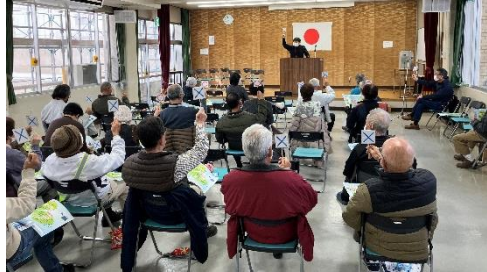
東部包括センターさんによる健康講話