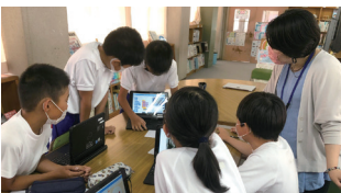
プログラミング教室