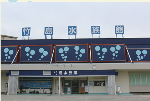
水族館は顔じゃなくて、中身で勝負！

るかもしれないと先を越されます。4、5くらいの可能性の時がチャンスです。自分の全ての能力を使い6や7にもっていき、物事を成功させるのがベストかと思えます。そういった意味で、今回はかなり無理をしたので決断・躊躇・心配度は過去最高に消耗する仕事でした。隣接する建物にも手を入れるので、リニューアルはまだ続きます。恐れや不安を振りほどき困難に立ち向かい、前に進む姿勢を大事にして変化していきます。4月1日に第1期リニューアルオープンします。ぜひ遊びに来てください！