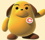
税関イメージキャラクター『カスタムくん』