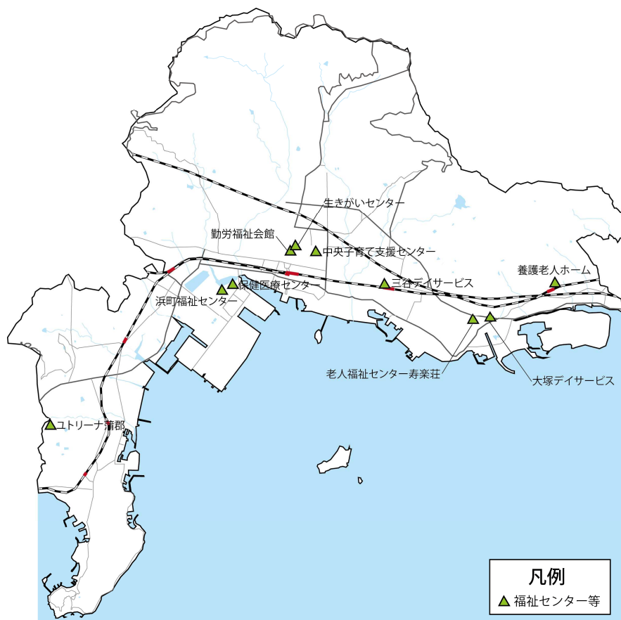
図 3-66 配置状況・外観写真（保健・福祉施設）