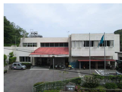
老人福祉センター寿楽荘