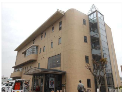
生きがいセンター