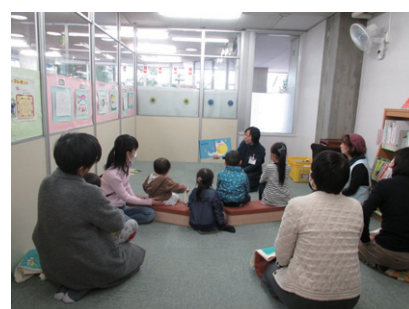
図書館での読みきかせの様子