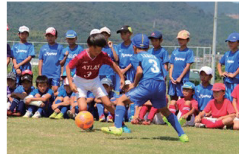
海陽多目的広場（スポーツ少年団活動）