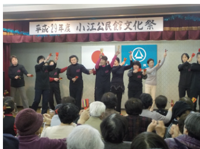
公民館文化祭の様子