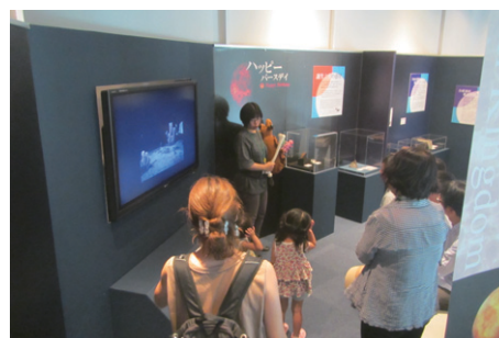
生命の海科学館特別展の展示