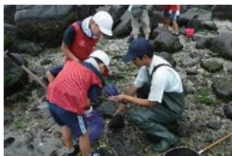
環境チャレンジ海での生き物採取の様子