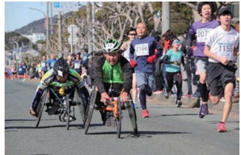
三河湾健康マラソン