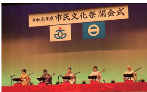
市民文化祭の様子