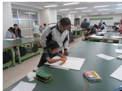
愛知工科大学での講座の様子